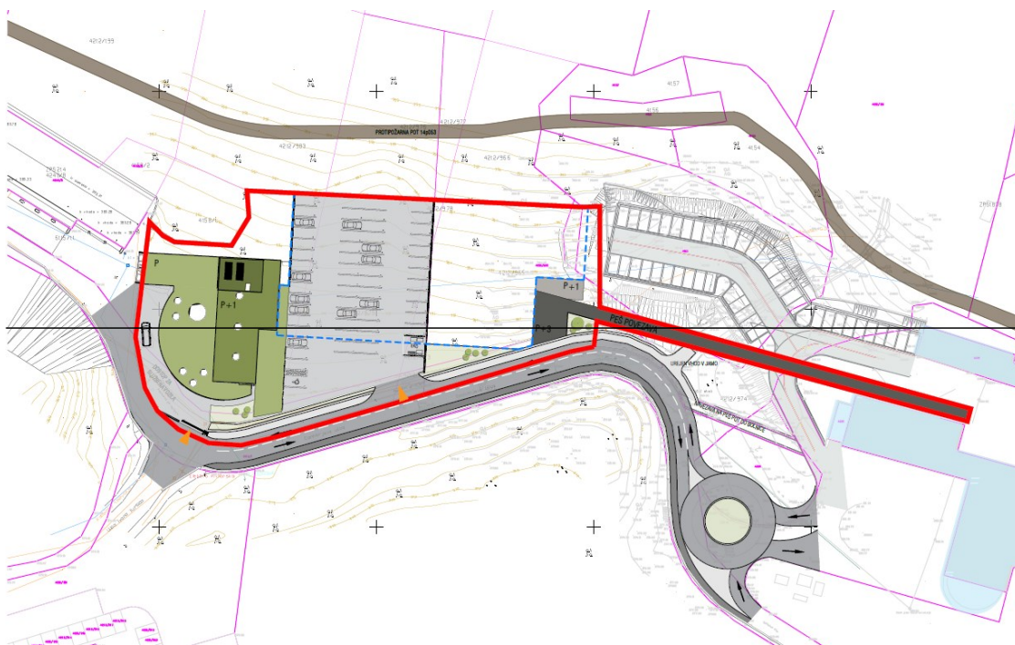
4. Prikaz območja OPPN - enota urejanja prostora SŽ-51 OPPN

Območje OPPN obsega parcele in dele parcel št. 4153, 4212/981, 4212/979, 4212/965, 4212/978, 4212/973, 4212/982, 4212/980, 4212/974, 4212/968, 4212/967, 4091, vse k.o. 2455 Sežana in meri okvirno 4.982 m 2 .